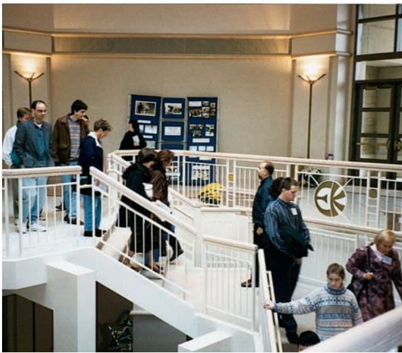
Die Eingangshalle ist der Begrüßungsort für die Tempelbesucher.