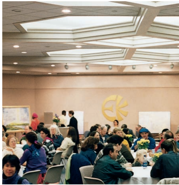
Im Gemeinschaftsraum finden Mitgliedertreffen, Sitzungen, Workshops und Empfänge statt.

An jedem ersten Sonntag im Monat findet um 10:00 Uhr im Tempelraum im Tempel von Eckankar ein Gottesdienst statt. Angehörige aller Glaubensrichtungen sind eingeladen, daran teilzunehmen.