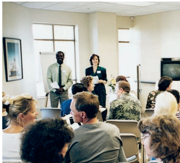
Die Unterrichtsräume im Tempel werden für Eckankar-Studienklassen, Zusammenkünfte und Einführungsveranstaltungen genutzt.

Der Ton Gottes war der brausende Wind, der die Jünger während des Pfingstfestes aufsuchte. Manche hören Ihn im Inneren. Man kann Ihn auch als rauschendes Wasser vernehmen; als einzelnen Ton einer Flöte; als Musik von Violinen, Holzblasinstrumenten oder Dudelsackpfeifen; oder sogar als das Summen von Bienen.