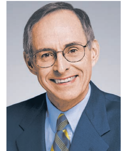
Sri Harold Klemp Der Mahanta, der Lebende ECK-Meister

Ein Traum ist eine Erfahrung aus dem wirklichen Leben, die man auf einer anderen Ebene Gottes hat. Als Seele, Ihrem wahren Wesen, sind Sie in der Lage, Erfahrungen in einem weit reichenden Panorama des Lebens zu haben.