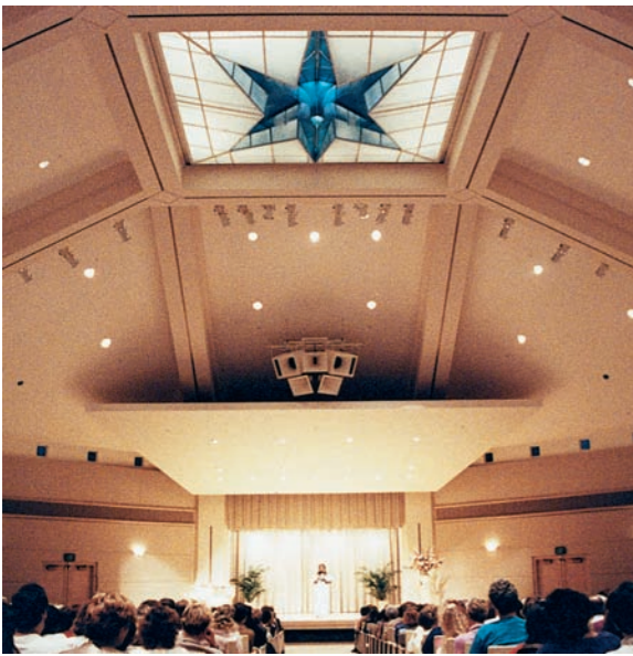
Im Tempelraum findet an jedem ersten Sonntag im Monat ein Gottesdienst statt.